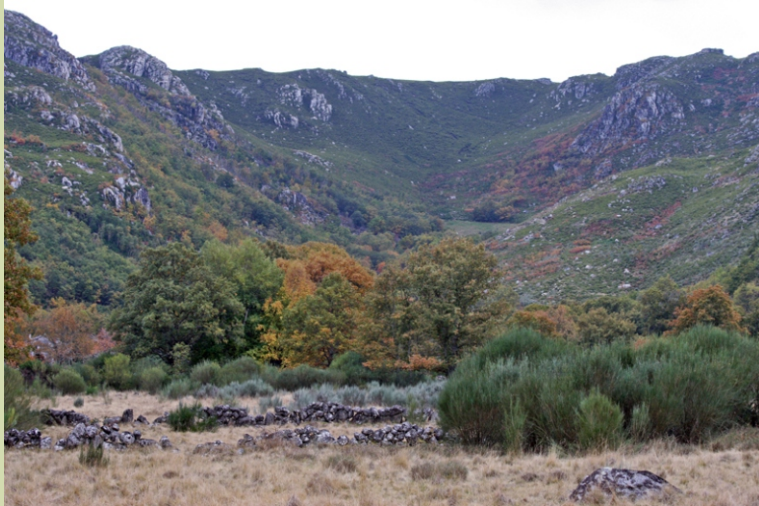
Circo glaciar de Prada ou Requeixo. A mellor época para visitar estes lugares é no outono cando as árbores mudan a cor ou na primavera cando a maioría das plantas florecen.

Para chegarmos a Requeixo , punto de arranque da ruta, na estrada de Manzaneda a Vilariño de Conso, entre Placín e San Miguel, collemos o desvío ao lugar. Podemos ir e vir polo mesmo camiño ou facer unha circular indo por un lado do val do río e volvendo polo outro. O primeiro tramo da ruta faise por unha pista ampla, pola que se pode circular cun coche todoterreo, que remata nos prados onde conflúen os regos de Lamas e de Requeixo . Polo camiño podemos ver, dispersas polo terreo, rochas que formaron parte das morenas ao tempo que gozar das amplas paisaxes porque aínda que camiñamos preto do fondo do val o espazo é tan aberto que permite gozar de amplos horizontes. Chegando ao final da pista temos dúas opcións ir á dereita para percorrer o val de Lamas e achegarse ao seu circo que se atopa na aba leste de Cabeza de Manzaneda, ou seguir de fronte onde a un quilómetro temos o lugar abandonado de Prada e desde el podemos seguir cara ao fondo do val glaciar. O tempo que pasou desde que non se transita polos camiños fai que a vexetación os borre polo que para achegarnos aos circos fai que teñamos que buscar os espazos polos que movernos, aproveitando sempre os camiños do gando e os sitios cubertos de herba e coa vexetación de menos altura.