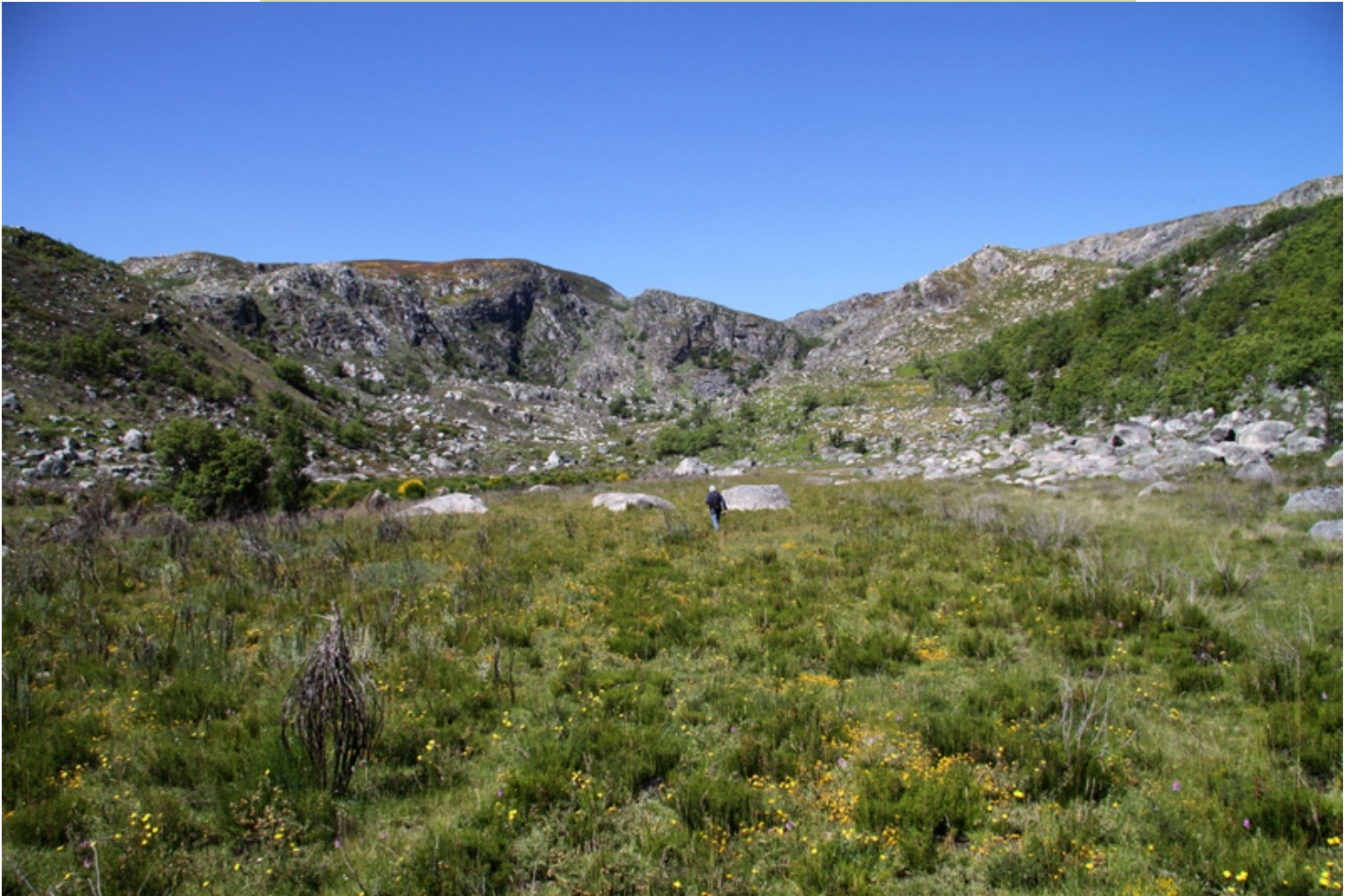
Circo glaciar de Lamas.