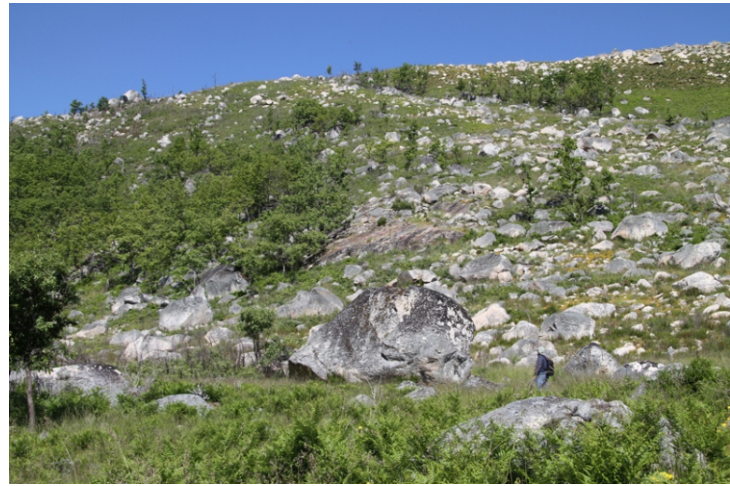
Desde o comezo da ruta hai boas panorámicas das abas da serra de Queixa na que se asentan os vales glaciares e vese unha paisaxe na que destaca a abundancia de bloques graníticos de formas máis ou menos redondeadas.

Prada, unha aldea abandonada que se asenta no val glaciar. Conserva os restos da capela dedicada a San Bartolomeu.