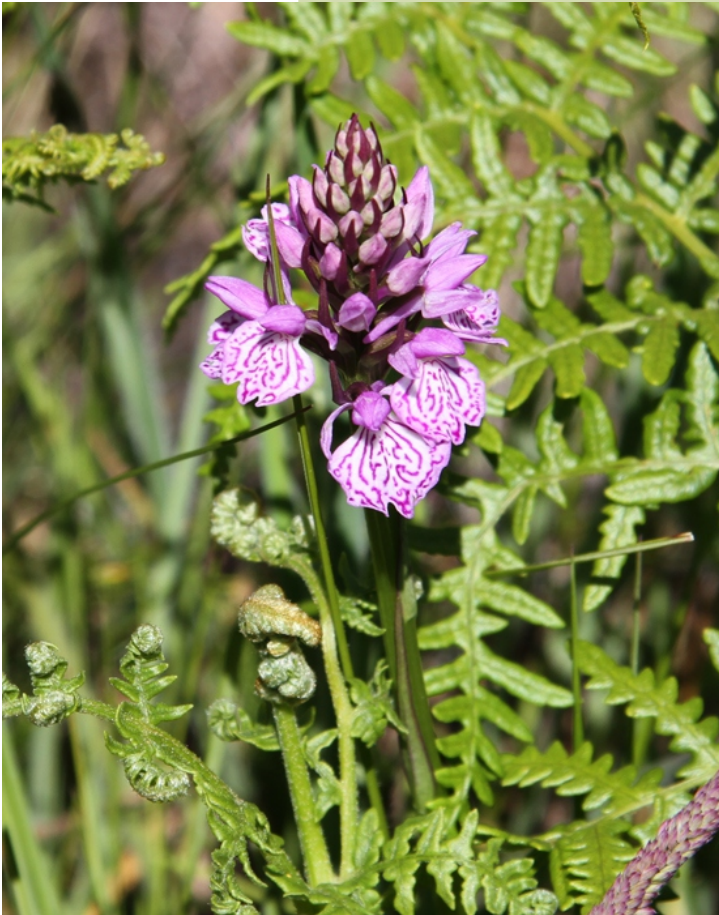
Dactylorhiza maculata , unha orquídea común nas zonas húmidas.