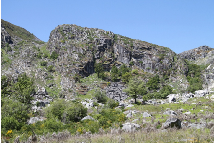
As Aguilladas no glacial das Lamas.