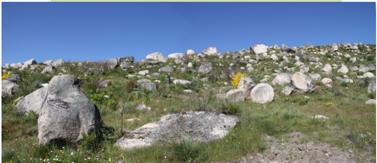
Bloques da morena do glacial de Lamas