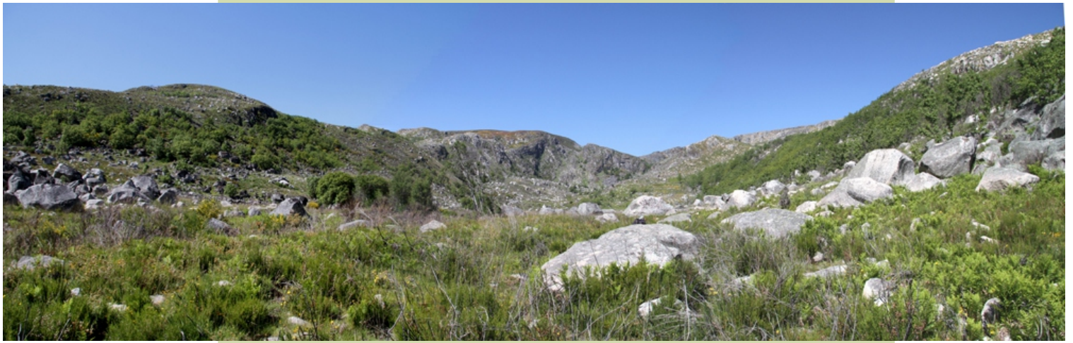
Circo glacial das Lamas (O Curro das Lagoas)