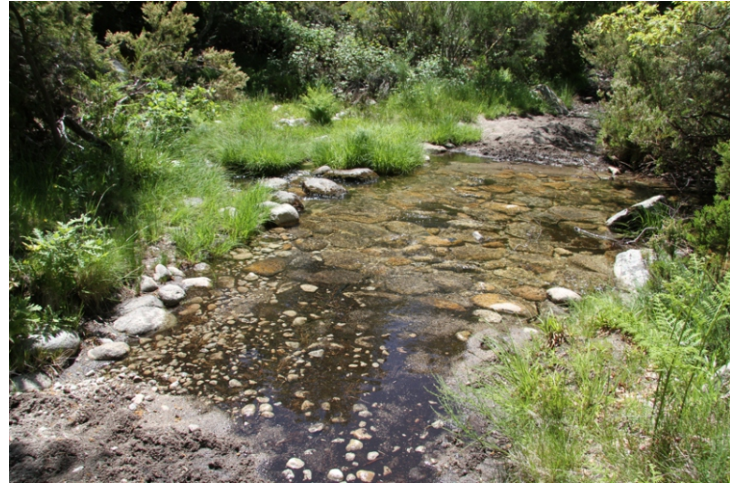
Porto no rego de Requeixo en Prada