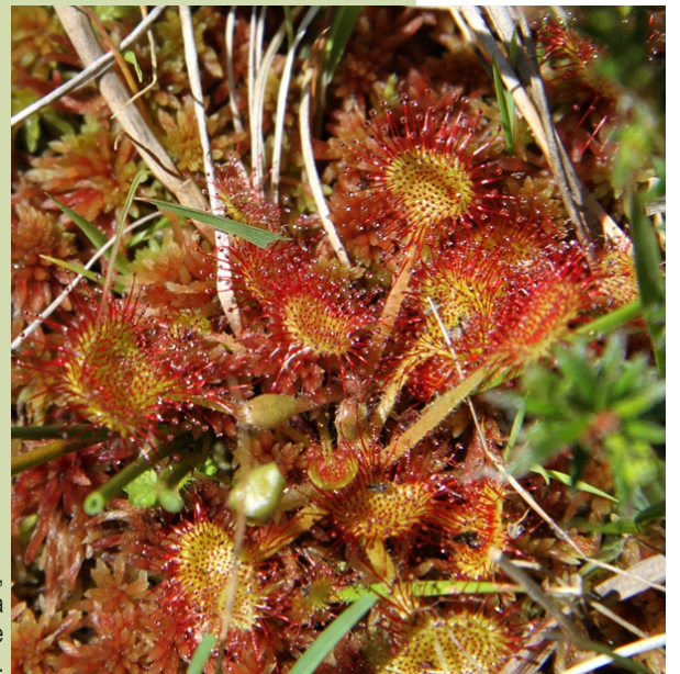
Drosera rotundifolia , planta insectívora das brañas de montaña.