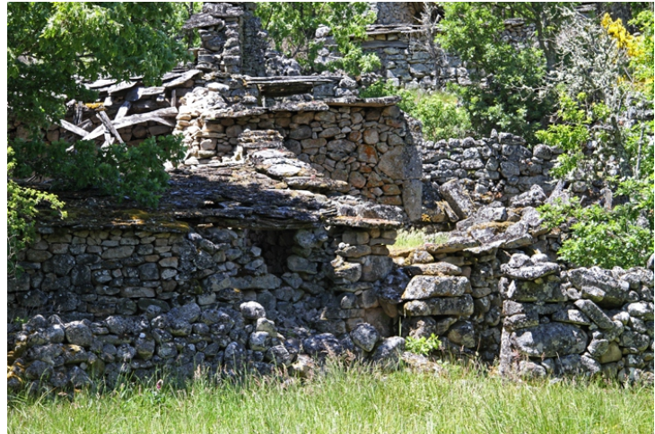
Detalle da aldea abandoada de Prada