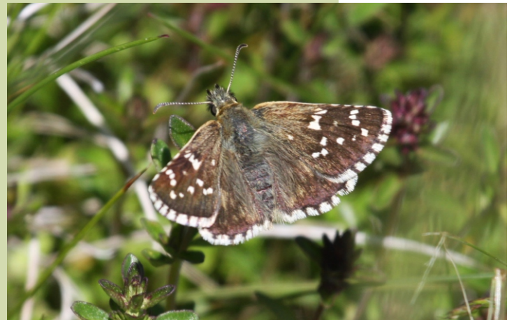
Pyrgus alveus , bolboreta escasa que se atopa en pradeiras de montaña de Lugo e Ourense